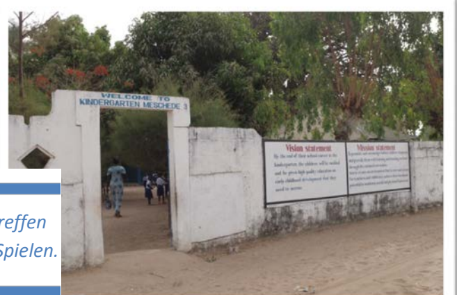
Freitags in Sanyang! Die Kinder tragen die T-Shirts, ab 9:00 Uhr treffen sich alle erst auf dem Schulhof und dann zum Singen, Tanzen und Spielen.