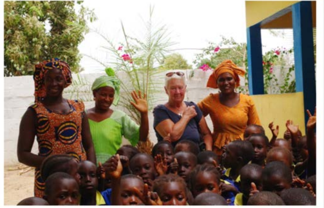
Zu Besuch in Tubakuta (oben) und Dimbaya. Hier wurde in den letzten Jahren viel erneuert und erweitert, Mitarbeiterinnen und Kinder sind sehr zufrieden. Als Gastgeschenk wurde ein Mandarinenbaum gepflanzt.